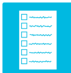
Liste des items